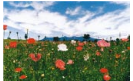
秋にはコスモスも咲きます