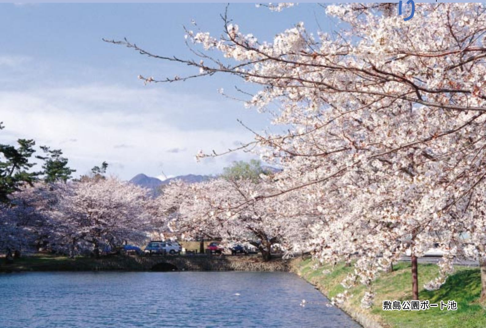
敷島公園ポート池