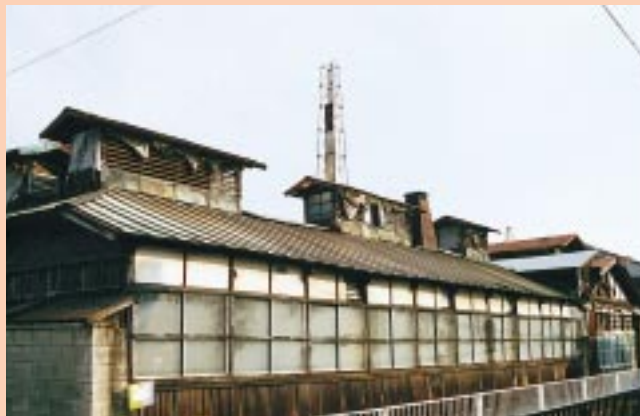
丸大製糸、製糸工場（国領町）