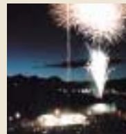
花火大会花火師に お聞きしました

前橋の花火大会は、主体が市や商工会議所でなく地元企業や個人ということが特徴で、市民総参加型の花火大会と言えます。打ち上げられる花火の数は約15,000発、県内の花火では最大規模です。空中ナイアガラや大渡橋を使ったナイアガラは素晴らしい。花火は年々カラフルになって行く傾向にあります。観覧は本部あたりが最も良いが、空に上がっているものですから、敷島公園内でもきれいです。