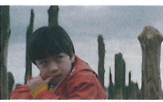
©2020 The Reason I Jump Limited, Vulcan Productions, Inc., The British Film Institute.

世界各地の5人の自閉症の少年少女たちの姿やその家族たちの証言を通して、自閉症と呼ばれる彼らの世界が、普通と言われる人たちとどのように異なっているのかを明らかにしていく。そして、自閉症者の内面がその行動にどのような影響を与えるかを、映像や音響を駆使して再現。彼らが見て、感じている世界を疑似体験しているかのような映像表現を紡ぎ、「普通とは何か?」という抽象的な疑問を多角的にひも解いていく。