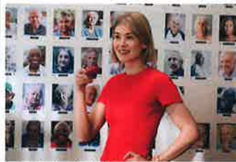
© 2020, BIP Care A Lot, LLC. All rights reserved.

公開：2021年/製作：2020年/アメリカ/118分/字幕/監督：J・ブレイクソン/出演：ロザムンド・バーク、ビクター・ディンクレイジ、エイザ・ゴンザレス、ダイアン・ウィースト