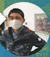
RIYUMI きょうりゅうのなかまたち

《洞生でぬぐい》にて制作されたてぬぐい用図案をTシャツ用に再構成。毎日飽くまい制作を続けるRIYUMIによる恐竜Tシャツ。