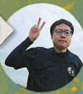
IMAI YUU ゴリかば

Tシャツのために即興的に描かれたゴリラたちと“かば”が一匹。YUUによるとはげたキャラクターたちの表情がとても良い感じ。