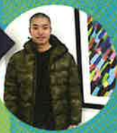
UBUKATA YUUKI 7 フクロウ

ポストカードに描かれた連作「鳥」を集めたデザイン。七匹の鳥の目が暗闇に光る、なんとも言えない妖しさが漂っています。