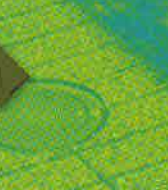
NAKAJIMA RYUKI カエル

「生き物百科事典シリーズ」第二弾。微妙な原画のタッチを再現しつつ、ドット表現を加えた大迫力のデザイン。カエル大好き。好きすぎてたまらない!