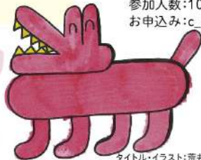
タイトル・イラスト:荒井 隆

全国の福祉施設のTシャツや雑貨もなります! また、会期中新作もどんどん追加予定ですので、そちらもお見逃しなく! 最新情報は、たんぼの家Instagram、またはGOOD JOB STOREをチェック!