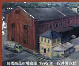
前橋商品市場倉庫 1995年 松井喜八郎

懐かしい思い出の写真、かつての情景を描いた絵画、記憶呼び起こす市街地図。あの頃の前橋を振り返る企画展。どうぞお気軽にご鑑賞ください。