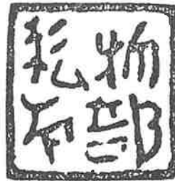
物部私印「矢中村東遺跡」