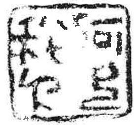
阿部私印「推定上野国府跡」