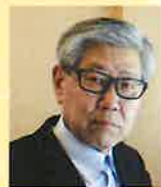
松浦寿輝 まつうら ひさき

作家・詩人・批評家。萩原朔太郎研究会会長。東京大学名誉教授(フランス文学・表象文化論)。日本芸術院会員。1954年東京都生まれ。東京大学大学院仏語仏文学専攻修士課程修了。詩集に『ウサギのダンス』『冬の本』(高見順賞)『鳥の計画』『吃水都市』(萩原朔太郎賞)『afterward』(鮎川信夫賞)『秘苑にて』など。小説に『花腐し』(芥川賞)『半島』(読売文学賞)『そこでゆっくりと死んでいきたい気持をそそる場所』『川の光』『名譽と恍惚』(谷崎賞・ドゥマゴ文学賞)『人外』(野間文芸賞)『無月の譚』など。エッセー・評論に『折口信夫論』(三島由紀夫賞)『エッフェル塔試論』(吉田秀和賞)『知の庭園 一九世紀パリの空間装置』(芸術選奨文部大臣賞)『明治の表象空間』(毎日芸術賞特別賞)『黄昏客思』『わたしが行ったさびしい町』など多数。