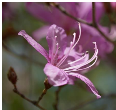
トウゴクミツバツツジ