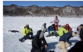
ワカサギの穴釣り(大沼)