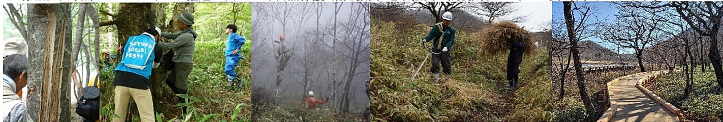
ニホンジカの食害 食害防止のネット巻き 眺望復元の為の枝払い ススキ・ササ刈り 遊歩道の補修とハリアフリー木道の新設

※赤城山山頂部のエコツーリズム推進エリアでは、自然保護・観光振興・地域振興・環境教育がバランス良く行われています。