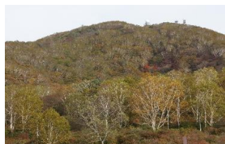
新坂平から望む地蔵岳