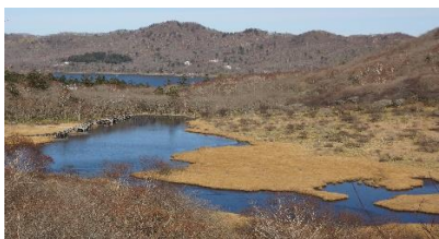
鳥居峠から覚満淵・大沼・薬師岳