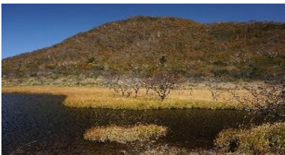
覚満淵・高層湿原