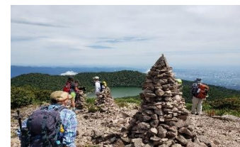
地蔵岳山頂のケルン・小沼