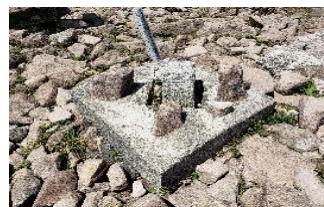
地蔵岳山頂の一等三角点