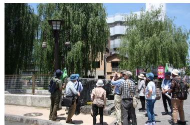
<R6 前橋モニュメント見学風景>

前橋は日本を代表する製糸都市。県都発展の礎は絹産業。今年は北コースを新設し、各コースとも内部見学箇所を設け、より深く前橋の絹産業を学習できる見学会としました。ぜひご参加ください