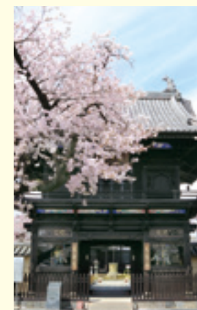
春には桜も美しい龍海院の門

境内には、前橋城主・重忠から第15代忠顕(ただてる 姫路城の7代藩主)まで酒井家歴代の墓所があります。