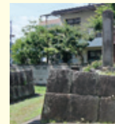
門の石積みが一部残る