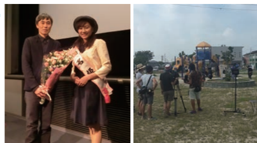
映画「ごっこ」舞台挨拶 映画「青の帰り道」