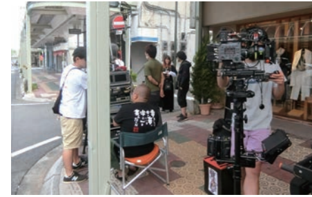
「そして生きる」撮影風景

前橋フィルムコミッションでは、映画、テレビ等の撮影場所の紹介や撮影支援を積極的に行っております。