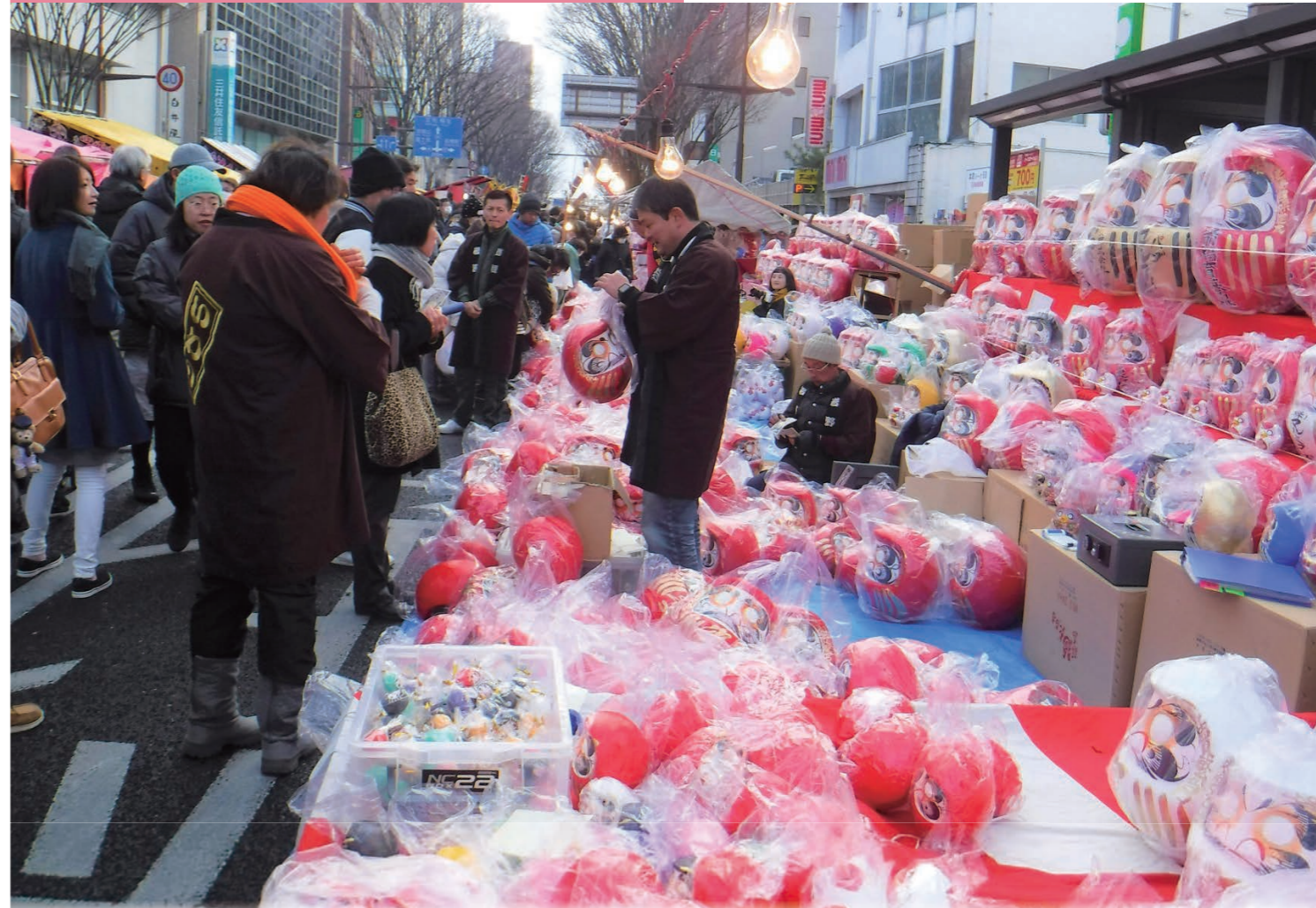
前橋初市まつり 国道50号露店

〒371-0023 群馬県前橋市本町2丁目12-1 K'BIX元気21まえばし1F TEL_027-235-2211 WEB_www.maebashi-cvb.com FAX_027-235-2233 MAIL_info_kanko@maebashi-cvb.com