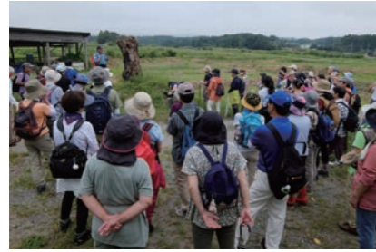
棚田の説明を受ける参加者