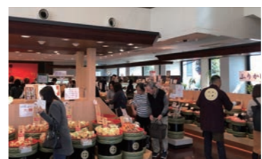
たむらや南部店にて

【団体名】特定非営利活動法人 医療福祉連携士の会 【実施日】令和元年11月24日(日) 【参加者】24名(バス1台) 【コース】前橋さくらホテル(研修会場)→臨江閣→群馬県庁展望ホール(昼食)→たむらや南部店→JR高崎駅