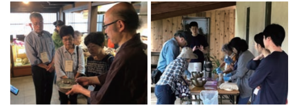
焼きまんじゅう試食

【開催日】 令和元年6月22日(土) 【コース】 高崎駅・前橋駅→原嶋屋総本家(試食)→Hütte Hayashi(生ハム醸造庫見学/昼食)→チーズ工房スリーブラウン(試食・チーズ作り体験)→柳澤酒造→前橋駅・高崎駅 ◎参加費 11,850円/定員 12名