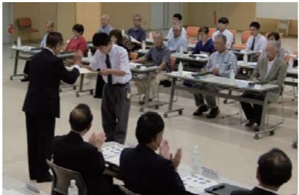
9月13日(金)表彰式の様子