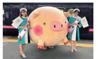
まんぶくグルメ列車で観光PR

◆「ぐんま×とちぎまんぶくグルメ列車」車内及び駅にて観光PR 前橋観光特使ローズクィーンと赤城山観光キャンペーンレディ赤城姫・淵名姫が、各日にそれぞれ列車に乗り込み、車内にてパンフレット配付や観光PRを行いました。 日付:6月29日(土)・6月30日(日) 場所:高崎駅～栃木駅間車内、前橋駅、岩宿駅ほか