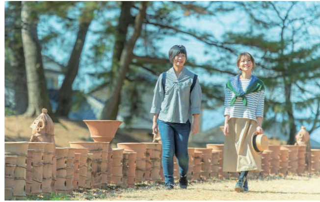
CM撮影が行われた中二子古墳

2020年4～6月の3か月間、群馬県内の市町村や観光関係者と全国のJR6社などが一体となって行う大型の観光キャンペーン「群馬デスティネーションキャンペーン」が開催予定で、当協会も積極的に関わっていきます。このキャンペーンに先がけ、JR東日本「大人の休日倶楽部【古墳王国 群馬篇】」のテレビCM撮影が、日本キャンパック大室公園（中二子古墳、前二子古墳）で行われました。女優の吉永小百合さんご出演のテレビCMは、JR東日本「大人の休日倶楽部」サイトより視聴可能です。なお、公園内では土日に売店も出店し、埴輪などのグッズ類も販売しております。ぜひ大室公園へ足をお運びください！