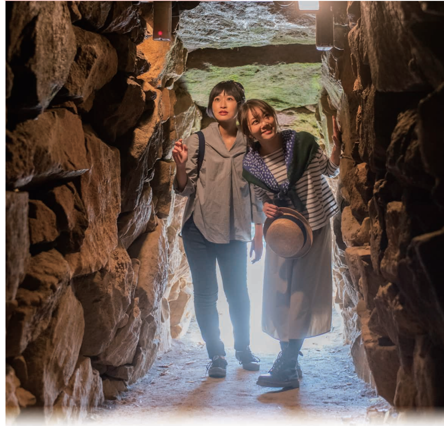
大室公園 前二子古墳 石室

〒371-0023 群馬県前橋市本町2丁目12-1 K'BIX元気21まえばし1F TEL_027-235-2211 WEB_www.maebashi-cvb.com FAX_027-235-2233 MAIL_info_kanko@maebashi-cvb.com