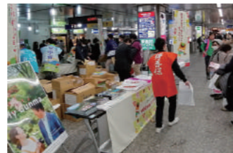
JR横浜駅でのキャンペーン

群馬県および県観光物産国際協会、ググッとぐんま観光宣伝推進協議会などの主催するキャンペーン事業に参加し、駅利用者に積極的に声掛けを行い、また、袋詰めしたパンフレットの配布やガラポン抽選会を行って前橋のPRを行いました。 2月13日(木) JR横浜駅 2月19日(水) JR上野駅 ※一部のキャラバンはコロナウイルス感染拡大防止策の一環として中止となりました。