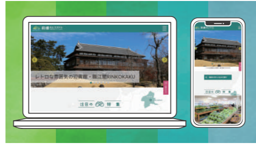
大型写真も多数掲載

前橋の観光情報を発信するWEBサイト「前橋まるごとガイド」を全面リニューアルしました。新たに目的地のマップ表示やGPSによるルート案内機能、目的地周辺の観光スポットやおすすめ情報、宿泊や体験プランの予約機能、アクセスランキング表示などを備え、季節やトレンドに合わせた前橋の観光情報を、直接手元に伝えるサイトに生まれ変わりました。スマホやタブレットからも利用できますので、ぜひご活用下さい。