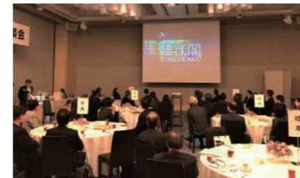
プレゼンテーション風景

1月23日東京會館(東京)において、7つの地方都市(旭川、秋田、前橋、岐阜、姫路、松山、鹿児島)が連携し、それぞれの都市で誘致したコンベンションの主催者を招き、翌年度以降の全国大会等の互いの誘致活動に結び付けることを目的とした情報懇談会を開催しました。各都市の魅力やコンベンション施設に関するプレゼンテーションを行い、当協会では、観光庁支援により臨江閣で実施されたユニークベニューを紹介するとともに、誘致に向けたPR活動を行いました。