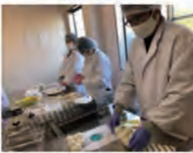
あんぴんもちづくり体験