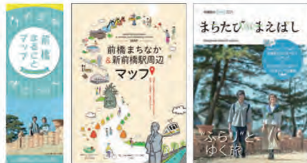
観光マップ・情報誌

設置場所:当協会窓口、前橋駅観光案内所、前橋市役所 および支所、市民サービスセンター等