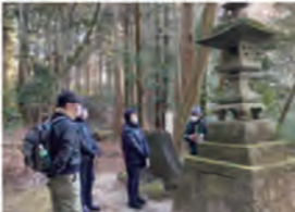
赤城神社と櫃石ハイキング