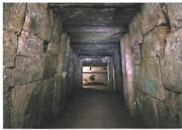
DATA 前橋市総社町総社1606

1辺約60m、高さ12mの方墳で、墳丘の周囲に巡らされた周堀を含めると1辺が100m以上の巨大な古墳です。横穴式石室は南側に開口しており、丁寧に加工された石材を巧みに組み上げた石室は圧巻です。さらに、石室内にはしっくい塗りが施されています。玄室には輝石安山岩でつくられた家形石棺が置かれています。7世紀中葉の築造と推定され、国指定史跡になっています。