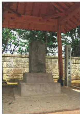
境内に建つ「力田遺愛碑」

このほか、境内に建つ「力田遺愛碑」(県指定史跡)は、慶長9年(1604年)に完成した天狗岩用水によって恩恵を受けた農民が、用水を開削した秋元長朝の業績に感謝し安政5年(1776年)に建てたものです。農民が殿様のために建てたこの碑は、全国的にも珍しいものです。