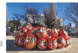
前回の焚き上げ準備の様子

【実施内容】・古だるま納所(前橋八幡宮境内) ・古だるまお焚き上げ(前橋八幡宮境内) ・渡御の儀 ・露店出店