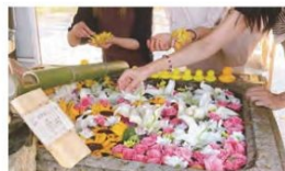
花手水体験 えんにち茶屋(上野総社神社)

今回は新しい取り組みとしてZOOMを活用した「オンライン体験」や、体験参加者の市内の回遊性を高め、飲食店の利用促進をする「体験+ Tea & Caféシールラリー」を開催しました。