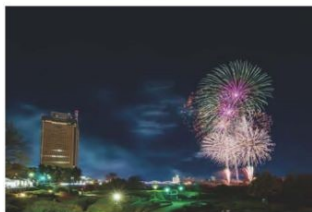
打ち上げ花火の様子

当協会では花火大会の事務局を担当しており、開催当日は実施委員会と連携して、職員も警備等の対応をしました。