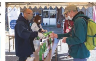
前回の地酒提供の様子