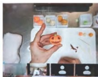
和菓子作り体験(オンライン) 御菓子司 新妻屋