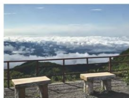
「櫻井・有吉 THE夜会」で紹介された赤城山鳥居峠から見た雲海の様子

【バラエティ】「櫻井・有吉THE夜会スペシャル」(TBSテレビ) / 赤城山(鳥居峠)