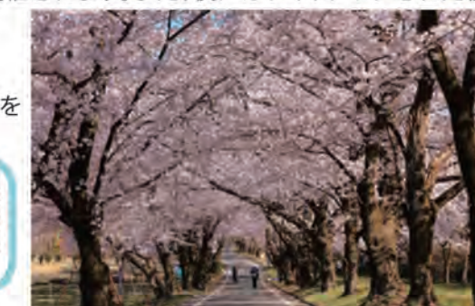
赤城南面千本桜の桜並木