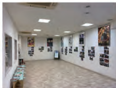
前橋フィルムコミッション展の様子

・前橋フィルムコミッション展「活動紹介ポスター・写真展」を、令和4年1月5日(水)～20日(木)の間、まちなかサロンにて実施しました。