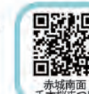
赤城南面千本桜まつり