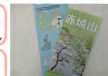
まえばし観光マップと百名山赤城山マップ