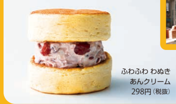
ふわふわぬきあんクリーム 298円(税抜)