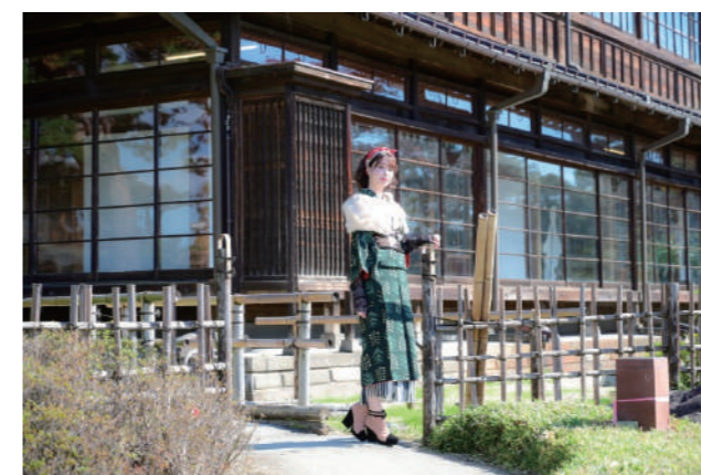
きものかわいい撮影会の様子

前橋市における絹文化やその歴史を見直し、新たな魅力の発見・発信を行うことを目的に、11月3日(木・祝)～11月9日(水)の期間で臨江閣にて「和のコトAsobi×ぐんまかわいいプロジェクト2022」を開催しました。