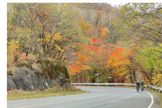
訪日観光客が赤城山のヒルクライムコースを登る様子