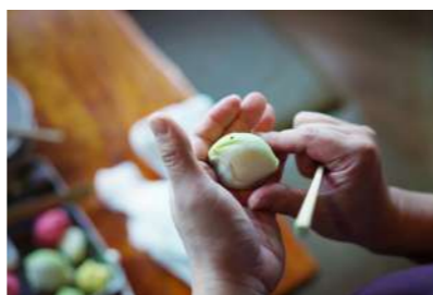
和菓子作り体験のイメージ