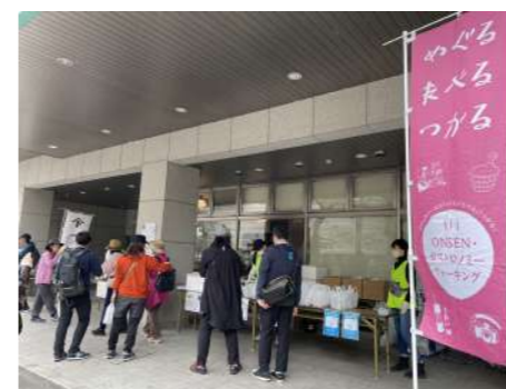
広瀬川付近での提供の様子

11月13日(日)に「第3回ONSEN・ガストロノミーウォーキングin前橋・赤城スローシティ」を開催しました。スローシティ前橋の新たな魅力を発信するため、地域のまつりをコースに入れた新たなコース設定をし募集したところ、県内外から161名の方が参加。地域の食や酒を堪能したり、ガイドによる臨江閣案内などを体験しながらウォーキングを楽しみました。