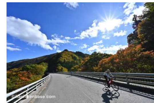
赤城山1周ライドの様子