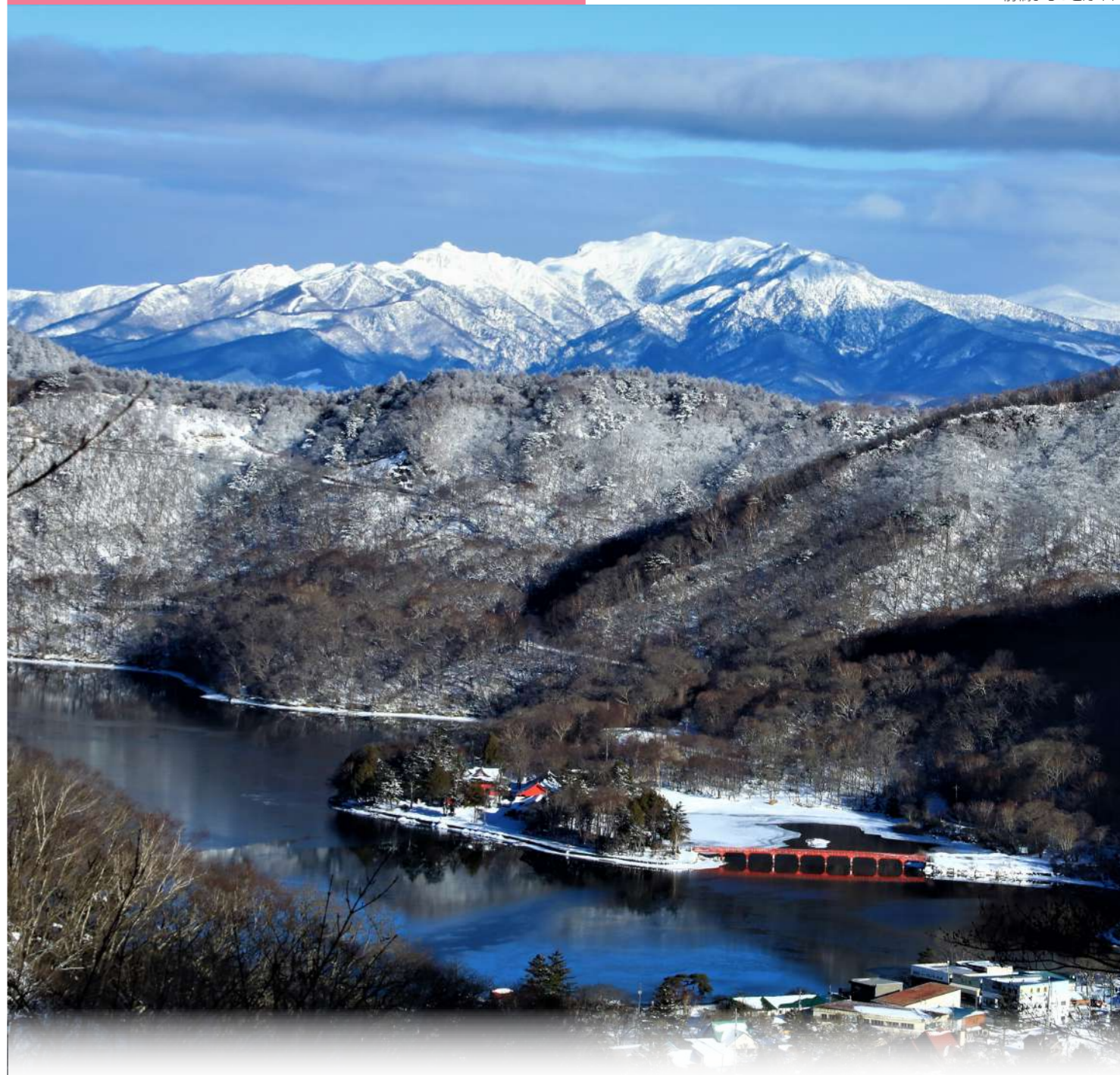
第41回前橋観光百景コンテスト入賞作品 作品名/早朝の武尊をのぞむ(2020年12月撮影) ※現在、啄木鳥橋は補修工事中です。