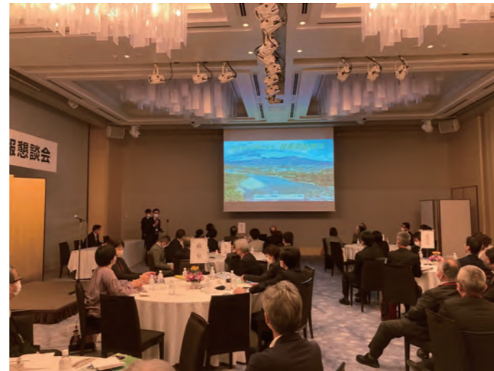
当日プレゼンの様子