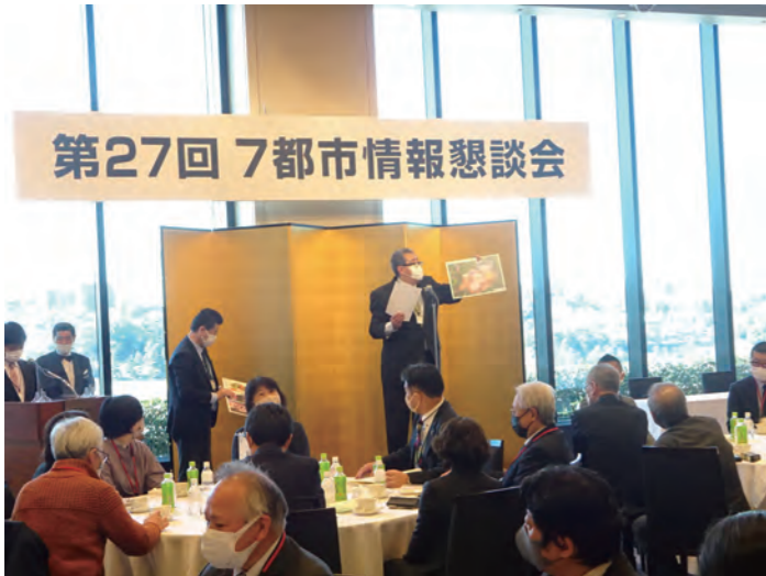
情報懇談会当日の様子