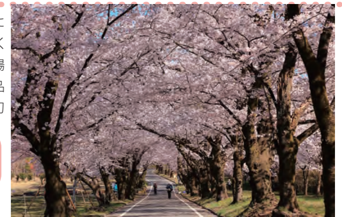
赤城南面千本桜並木