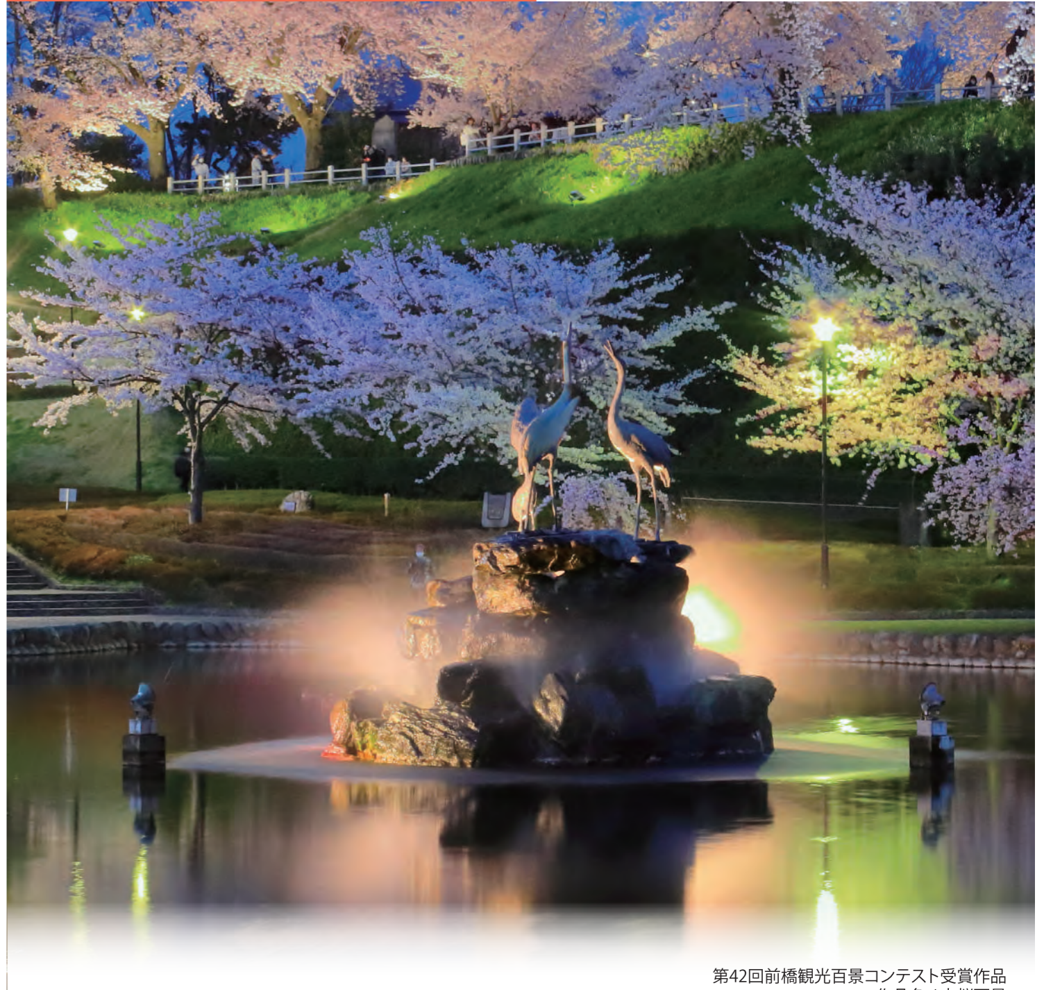
第42回前橋観光百景コンテスト受賞作品 作品名 / 夜桜百景