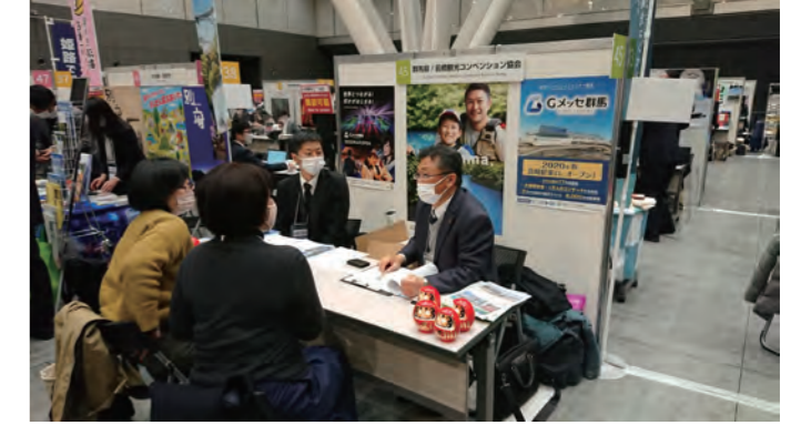
商談会当日の様子