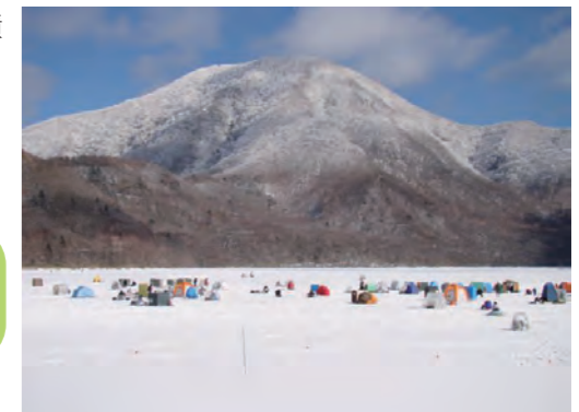
赤城大沼撮影イメージ