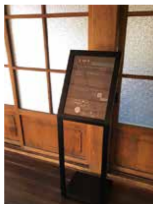
館内に多言語の案内版を設置