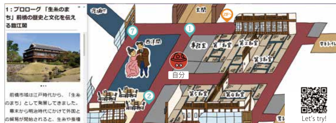
位置情報に連動して詳しい説明が閲覧できるデジタルルートマップを整備

令和4年度観光庁「地域独自の観光資源を活用した地域の稼げる看板商品の創出事業」に、国の重要文化財である臨江閣の活用策として提案した「群馬NEO迎賓館RINKOKAKU」が採択され、インバウンドに対応した多言語案内板や見学ルートマップを作成・設置しました。また臨江閣のユニークベニュー活用を促進するため、レセプションメニューや体験コンテンツをパッケージ化して公開し、利用しやすい体制を整備しました。