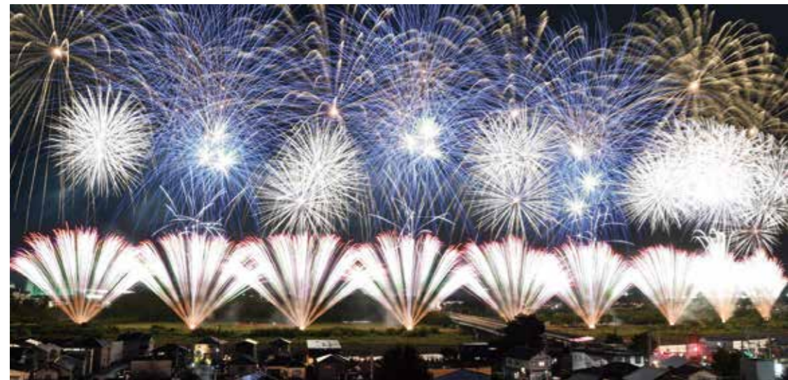
令和4年度 前橋花火大会 大渡橋周辺での打ち上げの様子

この前橋花火大会の開催を通じて、市内経済活動の活性化を促す機会とするとともに、その歴史と伝統を維持しながら、市民の地域への愛着や誇りを醸成し、その文化的価値を後世へ繋げていくため開催いたします。本年も皆様に喜んでいただける花火大会の開催に向けて準備を進めております。是非ご期待ください。