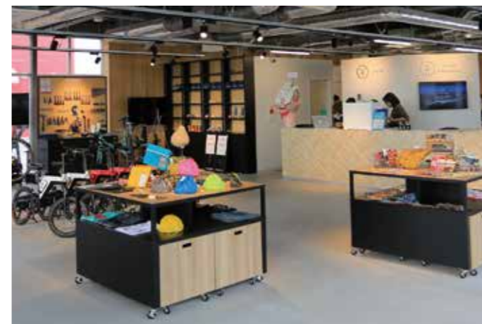
道の駅まえばし赤城 観光案内所 サイクルステーション

3月21日(火・祝)にオープンした群馬県内で33カ所目となる道の駅まえばし赤城内に当協会が運営する観光案内所がオープンしました。オープンから2カ月で70,000人を超える方が来所されています。当観光案内所はJNTO認定外国人案内所カテゴリ2の認定を受け、前橋市内・赤城山観光はもとより、県内広域を多言語で情報提供し、観光振興に努めてまいります。