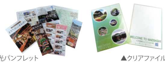
▲観光パンフレット

前橋の観光パンフレットや、「前橋の天然水 アカギノメグミ」(500ml)や協会オリジナルファイルなどのノベルティ類の提供をおこないます。