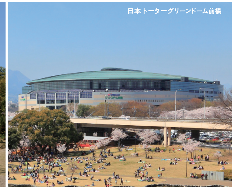
日本トヨタグリーンドーム前橋