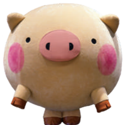
「TONTONのまち前橋」のキャラクター「ころとん」