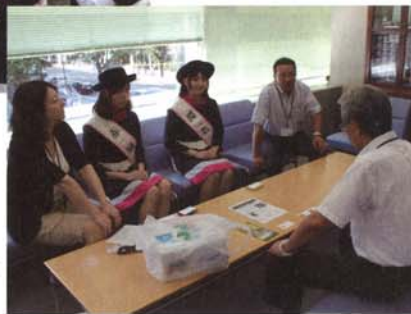
マスコミキャラバン スポニチほか2社