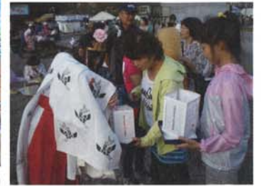
赤城山夏祭り 灯籠流し