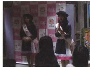
サロン・ド・ぐんま(前橋)