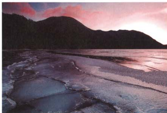
特選(前橋市長賞) 「明け色に染まる」石井 稔