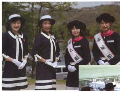
「新緑&つつじウィーク」 で新旧交代

6月2日の「新緑&つつじウィーク」でデビューした赤城姫・淵名姫。お祭り、マスコミキャラバンなど多方面で活躍しています。その一部をご紹介します。