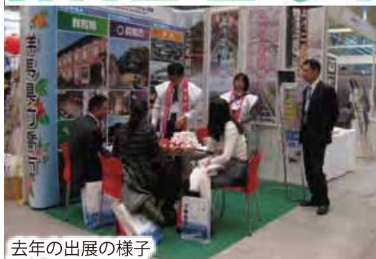
去年の出展の様子

IME 2014 第24回 国際ミーティング・エキスポ The 24th International Meetings Expo