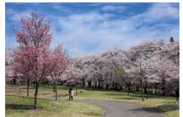
みやぎ千本桜の森から見た千本桜並木

千本桜まつり期間中は、地元の様々な品が並ぶ物産市や、大道芸や踊りなど各種お花見ステージ、桜の並木沿いには露店が連なります。夜にはぼんぼりが灯り、ライトアップされた桜が幻想的です。(夜間ライトアップは日没～21:30まで)