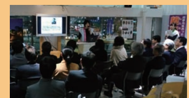
■県主催サロン・ド・G参加