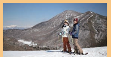
■広報用写真撮影(赤城山)